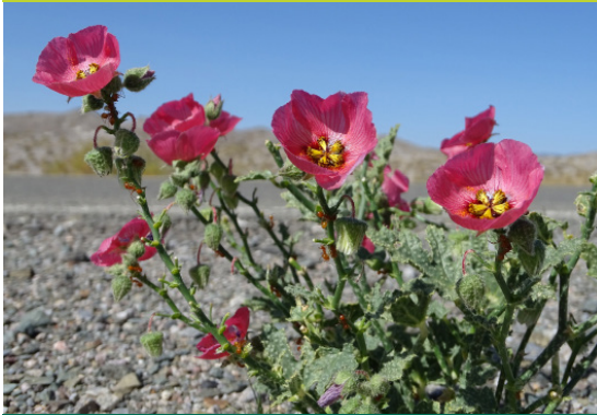
Huella - Lecanophora heterophylla - Hierba