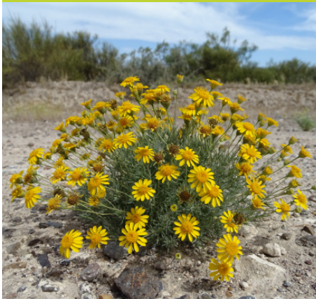
Perilla ó Manzanilla de monte Thymophylla pentachaeta - Hierba