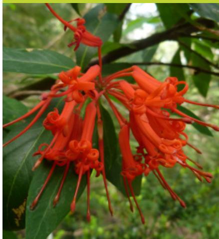
Notro Embothrium coccineum - Arbolito