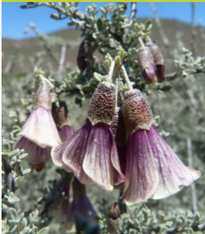
Monte Moro Corynabutilon bicolor - Arbusto