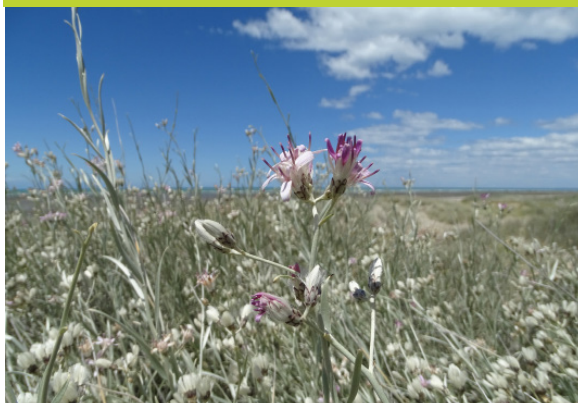
Olivillo ó blanquilla u Oreja de conejo Hyalis argentea - Subarbusto