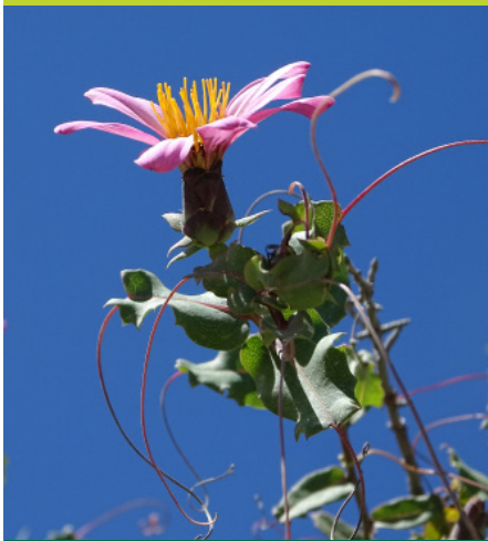
Reina mora Mutisia spinosa - Enredadera