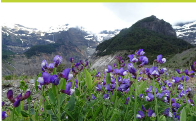
Arvejilla - Lathyrus magellanicus - Enredadera